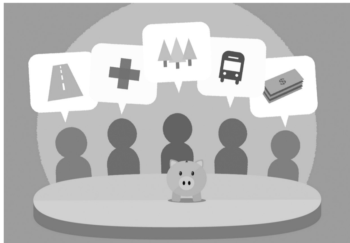
Imagine simbol, sursa: nextcity.org

de calitate, trebuie să punem presiune asupra statului să-și optimizeze activitatea. Dacă nu plătim impozite, serviciile vor fi de o calitate și mai slabă. Totodată, statul ar trebui să diminueze gradul de corupție și să presteze servicii de calitate. Să simplifice interacțiunile cu Fiscul. Să promoveze educația fiscală la școală. Să introducă pedeapsa cu închisoarea pentru evaziune fiscală gravă. Să confişte averile nedeclarate.