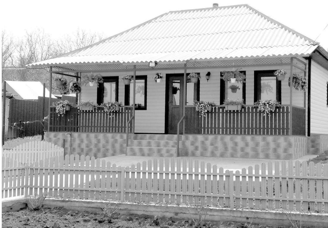
Casa părinților restaurată de copii, Crăsnășeni, Telenești