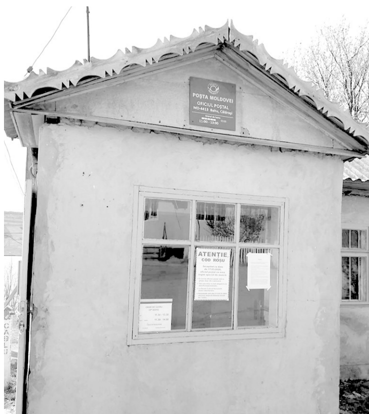
Oficiul poștal MD-4413, Bahu, Călărași