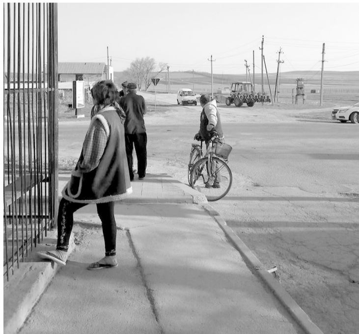
În așteptarea pâinii, Inești, Telenești