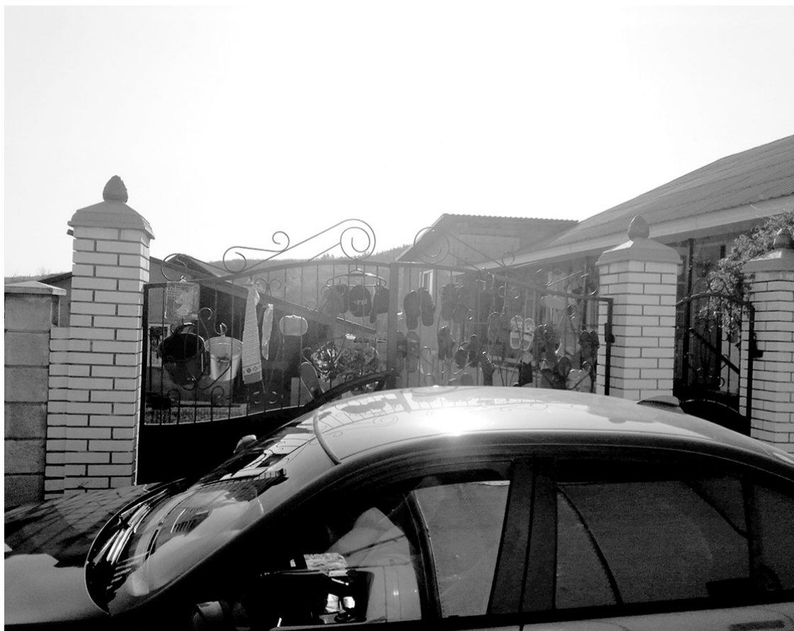
Formă de comerț pe timp de coronavirus la Inești, Telenești